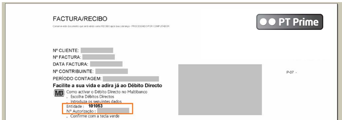
Imagem 2 – Exemplo Factura PT Prime