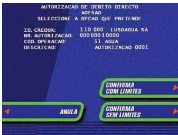
Ecrã 4 – Confirmação da Autorização de Débito em Conta