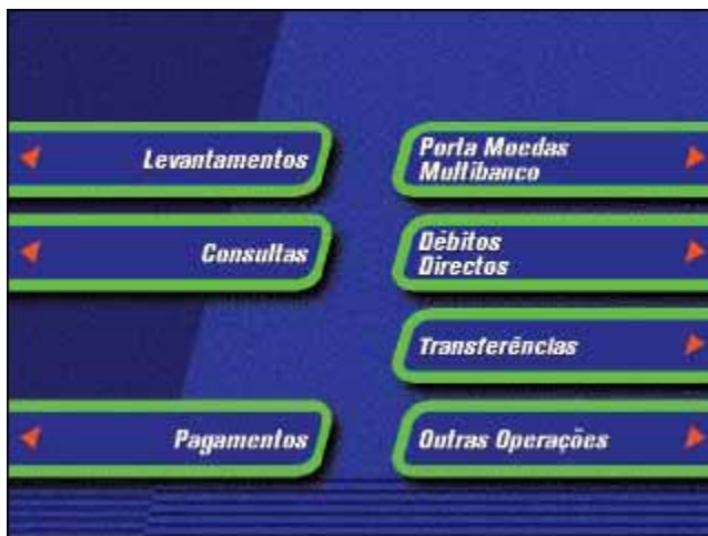
Ecrã 1– Inicial