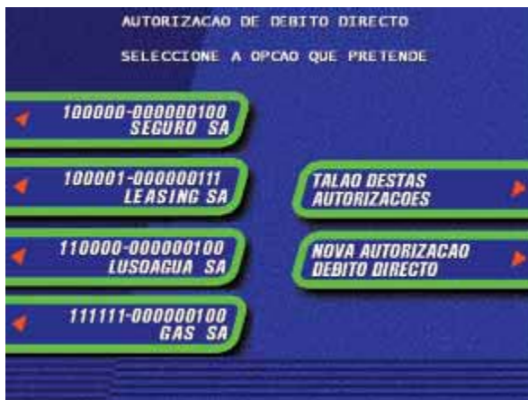
Ecrã 3 – Autorizações já concedidas